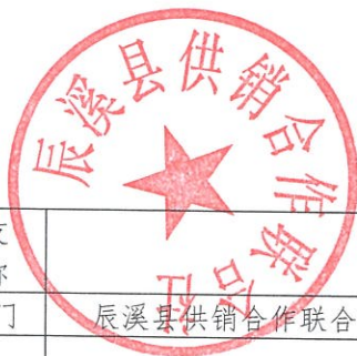
项目支出绩效自评表